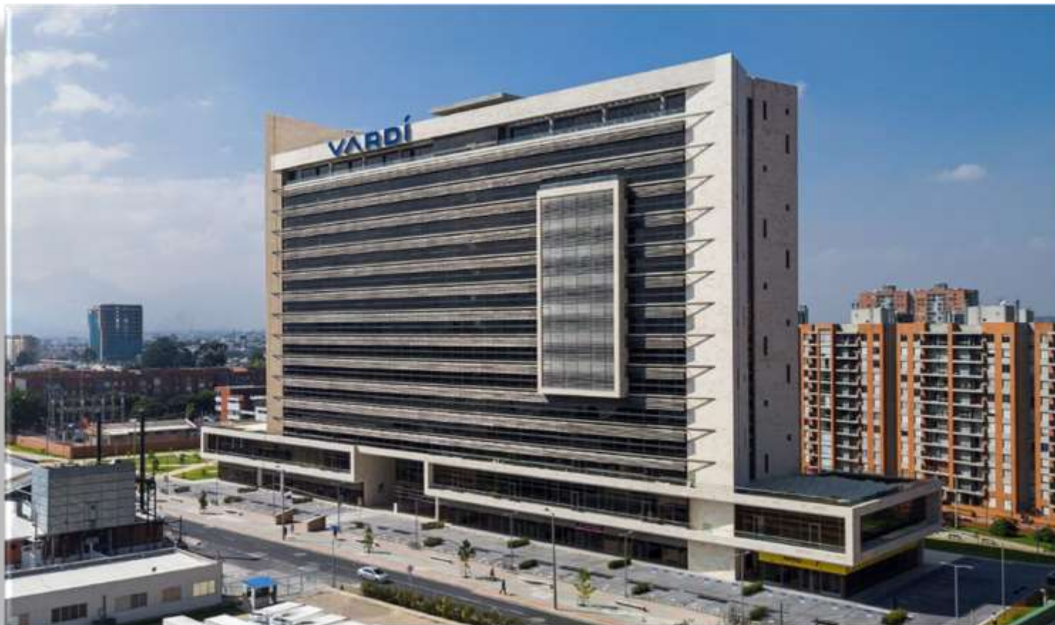
Edificio Centro Empresarial Pontevedra Ubicado en Bogotá Calle 98 # 70 - 91